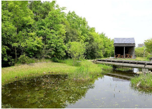
バンビの里 ビオトープ