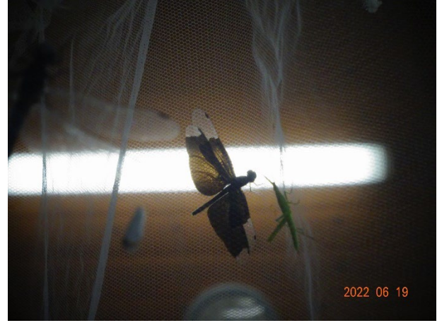
採取したトンボやバッタ

ふれあい緑地ビオトープには、池や田んぼや小川、小さな丘や原っぱがあり、多くの生き物が生息しています。トンボ、チョウ、バッタなどの昆虫のほか、水路や田んぼにはカエル、貝、小魚などもいます。