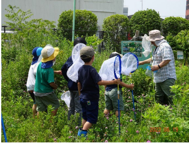
昨年の開催の様子