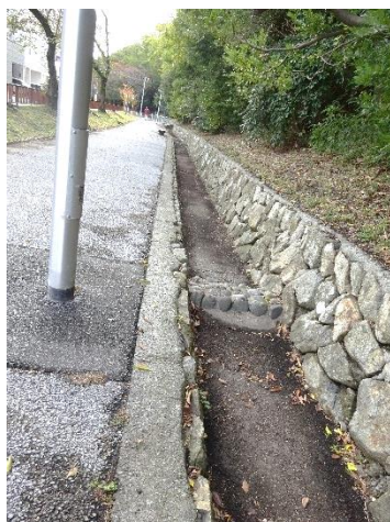
清掃作業後の様子