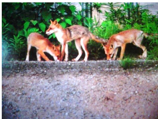
豊中市史「自然」編に掲載されたキツネ一家