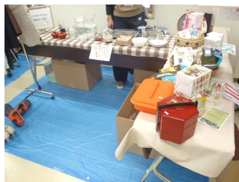
ブースの出店イメージ