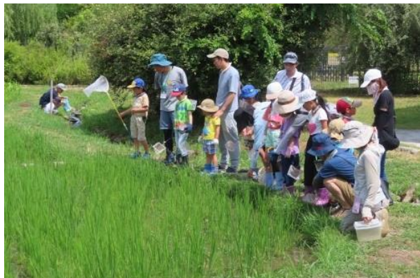
田んぼビオトープでの生き物の採集や観察 1