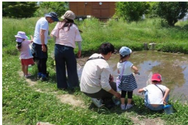
田んぼビオトープでの生き物の採集や観察 2

ふれあい緑地ビオトープには、池や田んぼ、小川、小さな丘、原っぱがあり、多くの生き物が生息しています。トンボ、チョウ、バッタなどの昆虫のほか、水路や田んぼにはカエル、貝、小魚などもいます。