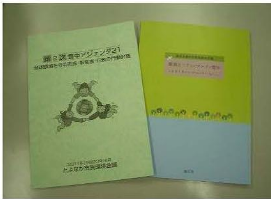
第2次豊中アジェンダ21（左）と 第2次豊中市環境基本計画（右）

豊中の環境の計画は、行政の計画である「豊中市環境基本計画」と、市民・事業者・行政の行動計画「豊中アジェンダ21」があります。2つの計画はそれぞれ「望ましい環境像」「環境目標」などを共有しており、車の両輪として位置づけられています。その実現に向けて、市民・事業者・行政の協働とパートナーシップにより取り組んでいます。