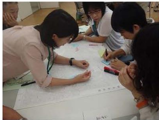
市民ワークショップの様子

2つの計画は、1999年に初めて策定され、現在は第2次ですが、今年度から新たに第3次の計画を作ることになりました。そこで、計画を作るにあたり、『豊中の現状と課題』や、『市民・事業者・行政の行動計画』について、みんなで日頃感じていることやアイデアを出し合います。